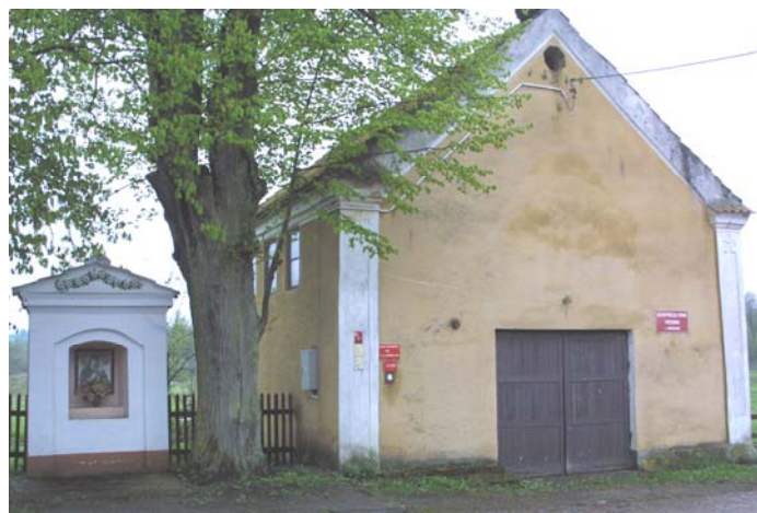
Rys.9. Budynek OSP Unikowo