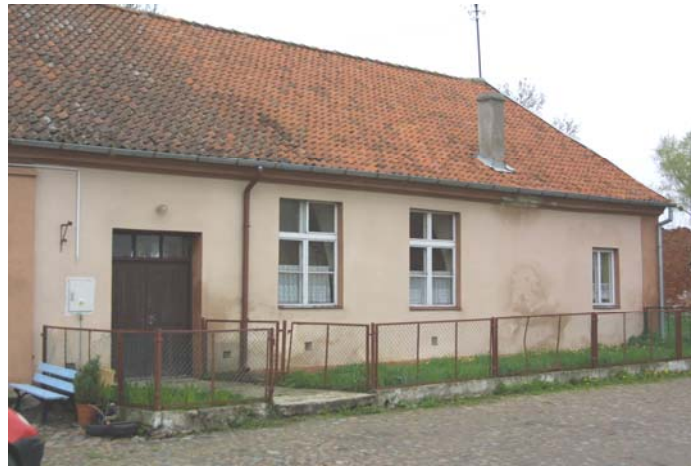
Rys.10. Budynek przeznaczony na świetlicę we wsi Unikowo

znaczący wpływ będzie miało wyremontowanie oraz wyposażenie świetlicy w niezbędne sprzęty tj. stoły, krzesła, szafki, multimedia (televizor, odtwarzacz DVD) oraz sprzęt sportowy.