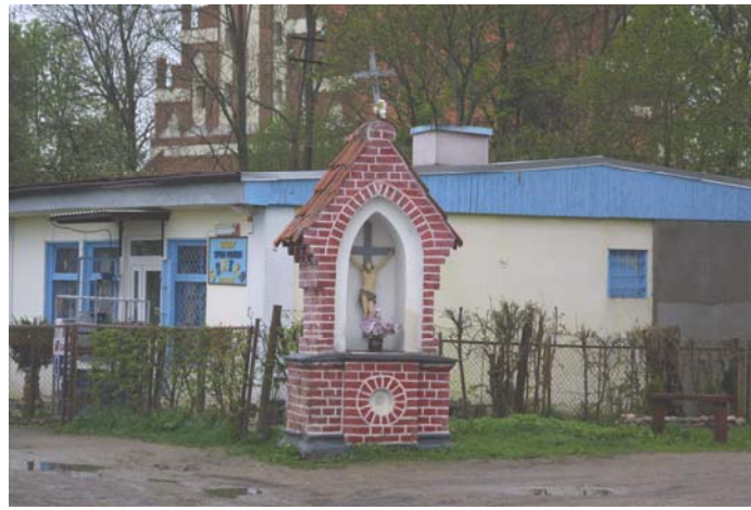
Rys.5. Sklep spożywczo-przemysłowy w miejscowości Unikowo

Unikowo to miejscowość typowo rolnicza, dominują tu indywidualne gospodarstwa rolne. Na terenie wsi znajdują się również dwa sklepy spożywczo-przemysłowe.