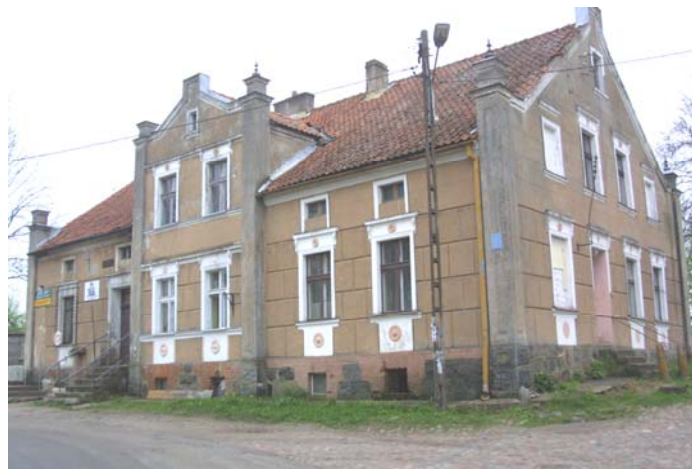
Rys.8. Dwór w miejscowości Unikowo. Widok od strony kościoła

W miejscowości znajduje się dwór, numer rejestru zabytków: A-2819 z dnia 9.05.1989r. oraz budynek OSP.