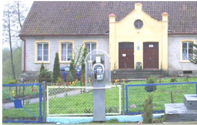
Rys.10. Budka telefoniczna we wsi Unikowo

Na terenie miejscowości możliwe jest podłączenie do sieci TP (z dostępnymi usługami Neostrada TP oraz DSL TP). Zasięg mają również operatorzy sieci telefonii komórkowej: Orange, Era oraz Plus. Na terenie miejscowości możliwe jest podłączenie do sieci bezprzewodowej dostarczanej przez firmę ARKUSNET z Olsztyna.