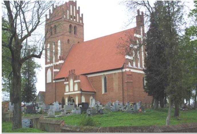
Rys.6. Kościół parafialny p.w. św. Jana Chrzciciela w Unikowie