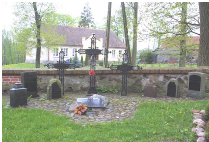
Rys.7. Cmentarz rzymskokatolicki wraz z fragmentem muru gotyckiego