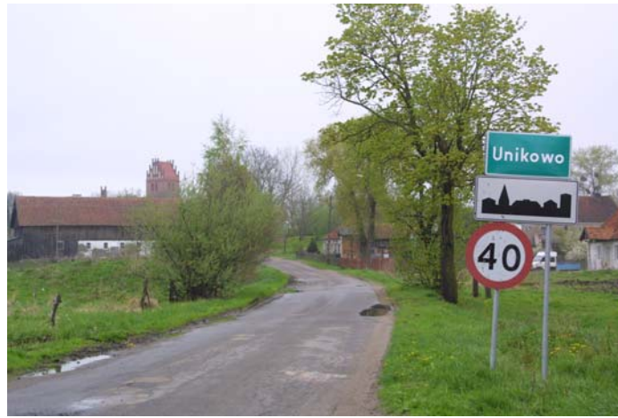
Rys. 1. Miejscowość Unikowo. Widok z drogi powiatowej nr 26509

Miejscowość Unikowo – wieś w województwie warmińsko-mazurskim, w powiecie bartoszyckim, w gminie Bisztynek. Położona około 11 kilometrów od Bisztyńka w kierunku Reszła. Odległości od innych ważniejszych miast regionu wynoszą: do Bartoszyc - około 32 km., do Olsztyna – 55 km, a do Reszła - ok. 13 km. Miejscowość usytuowana jest na szlakach o znaczeniu powiatowym i gminnym. Przez miejscowość przebiega droga powiatowa nr 26509 relacji Lutry-Sątopy. Wieś zajmuje powierzchnię 1024 ha.