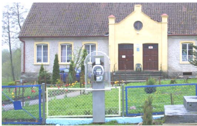
Rys.10. Budka telefoniczna we wsi Unikowo

Na terenie miejscowości możliwe jest podłączenie do sieci TP (z dostępnymi usługami Neostrada TP oraz DSL TP). Zasięg mają również operatorzy sieci telefonii komórkowej: Orange, Era oraz Plus. Na terenie miejscowości możliwe jest podłączenie do sieci bezprzewodowej dostarczanej przez firmę ARKUSNET z Olsztyna.