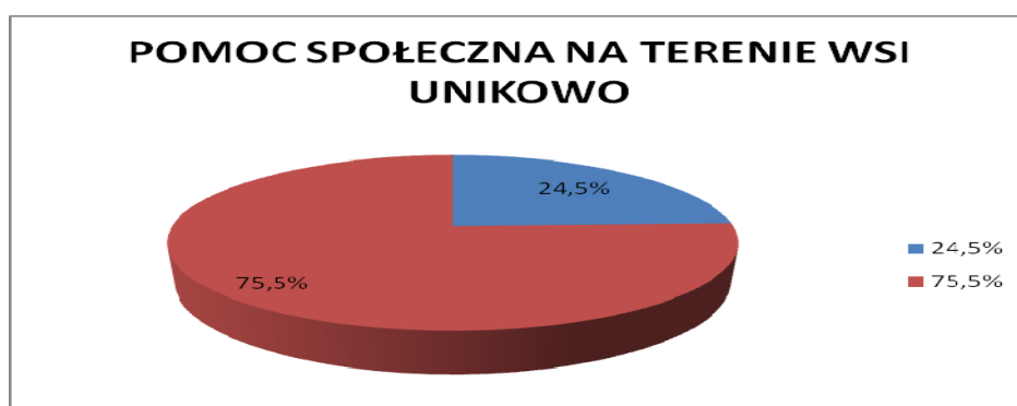
Rys. 4. Udział osób korzystających z pomocy społecznej na tle mieszkańców miejscowości Unikowo

Lista osób korzystających z pomocy społecznej (stan na 31 grudnia 2009r.) w miejscowości Unikowo – 16 rodzin (57 osób)