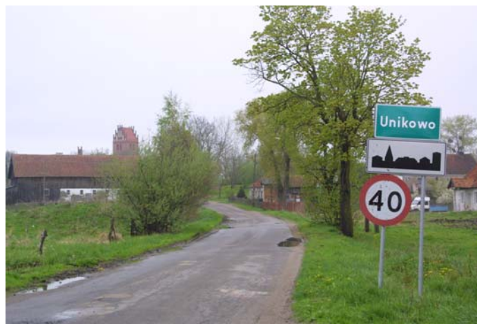
Rys. 1. Miejscowość Unikowo. Widok z drogi powiatowej nr 26509

Miejscowość Unikowo – wieś w województwie warmińsko-mazurskim, w powiecie bartoszyckim, w gminie Bisztynek. Położona około 11 kilometrów od Bisztyńka w kierunku Reszła. Odległości od innych ważniejszych miast regionu wynoszą: do Bartoszyc - około 32 km., do Olsztyna – 55 km, a do Reszła - ok. 13 km. Miejscowość usytuowana jest na szlakach o znaczeniu powiatowym i gminnym. Przez miejscowość przebiega droga powiatowa nr 26509 relacji Lutry-Sątopy. Wieś zajmuje powierzchnię 1024 ha.